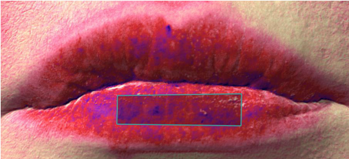
使用 29 日後

分光測色計によるヘモグロ ビン量指標は、全被験者平 均で +0.39 上昇した。