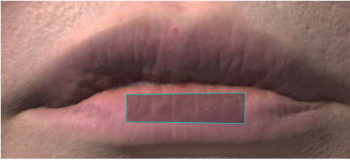
使用 29 日後